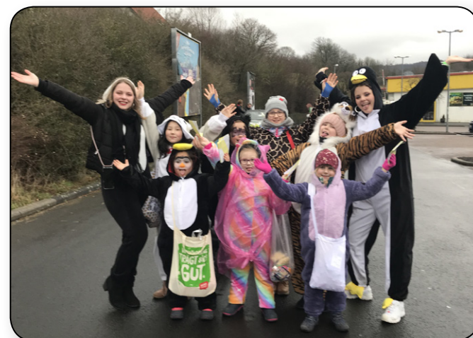
Faschingsumzug in Gedern 2021