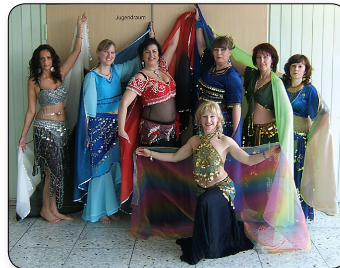
Die orientalische Tanzgruppe beim Frhlingstanz 2007