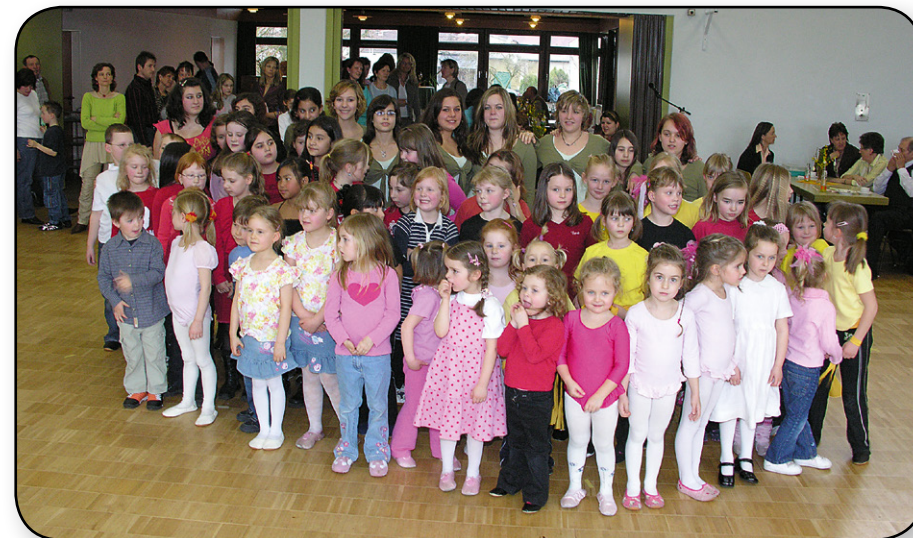
Gruppenbild vom 1. Frühlingstanz 2006

2006 fand er zum ersten Mal statt und ist seitdem ein fester Bestandteil unserer Jahresplanung und einfach nicht mehr wegzudenken - der Frühlingstanz .