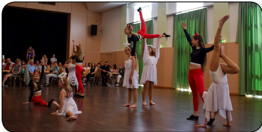
Die Tanzkids beim Frühlingstanz 2019