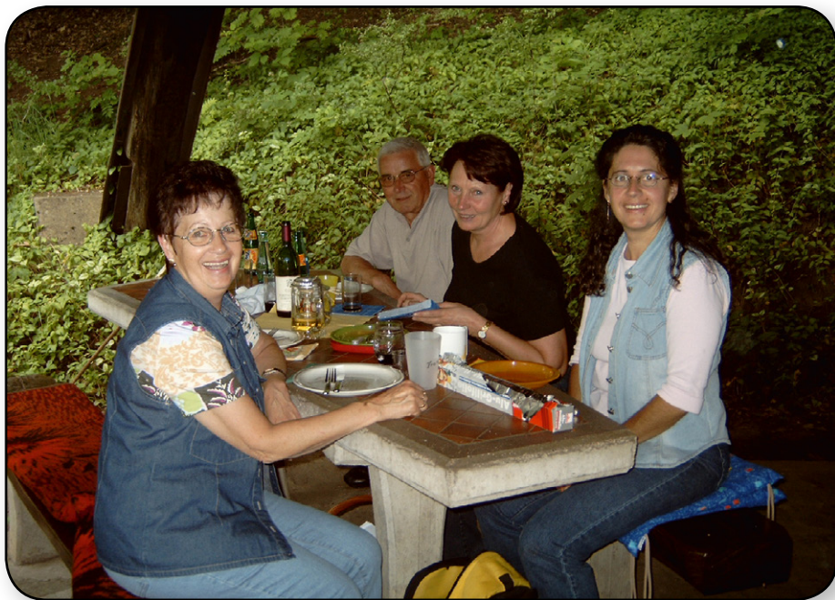
Grillfest 2003 auf dem Grillplatz in Ober-Lais

Über die Jahre gab es auch einige Veranstaltungen, bei denen nicht das Tanzen im Vordergrund stand, sondern die Möglichkeit mit Tänzerinnen und Tänzern aus anderen Gruppen Kontakte zu knüpfen. Hierzu wurden Geburtstagsfeiern, Grillfeste, Ausflüge, Weihnachtsfeiern und vieles Weitere geplant.