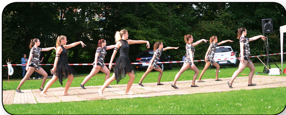
Die Gruppe Fairytale beim „Kleinen Tanzfest“

Da der Frühlingstanz 2021 zum 2. Mal ausfallen musste, wurde spontan ein kleines Tanzfest in Gedern auf dem Handballplatz organisiert.